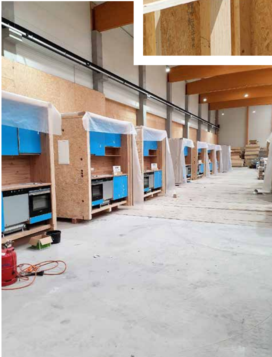
Fertige Bad- und Küchenmodule mit tragender Funktion, Foto Dirk Heidschuster

Digitalisierung im Bauwesen heißt digitale Planung, digitale Produktion, digitale Formfindung und das digitale Bauen (BIM). Dies stellt viele Zimmereibetriebe vor eine enorme Herausforderung. Nicht jeder kann hier sein digitales Bausystem aufbauen. Aber ein Netzwerk kann hier helfen und Teile der Planung auslagern. Mit hagekon haben wir in der hagebau ein funktionierendes Netzwerk.