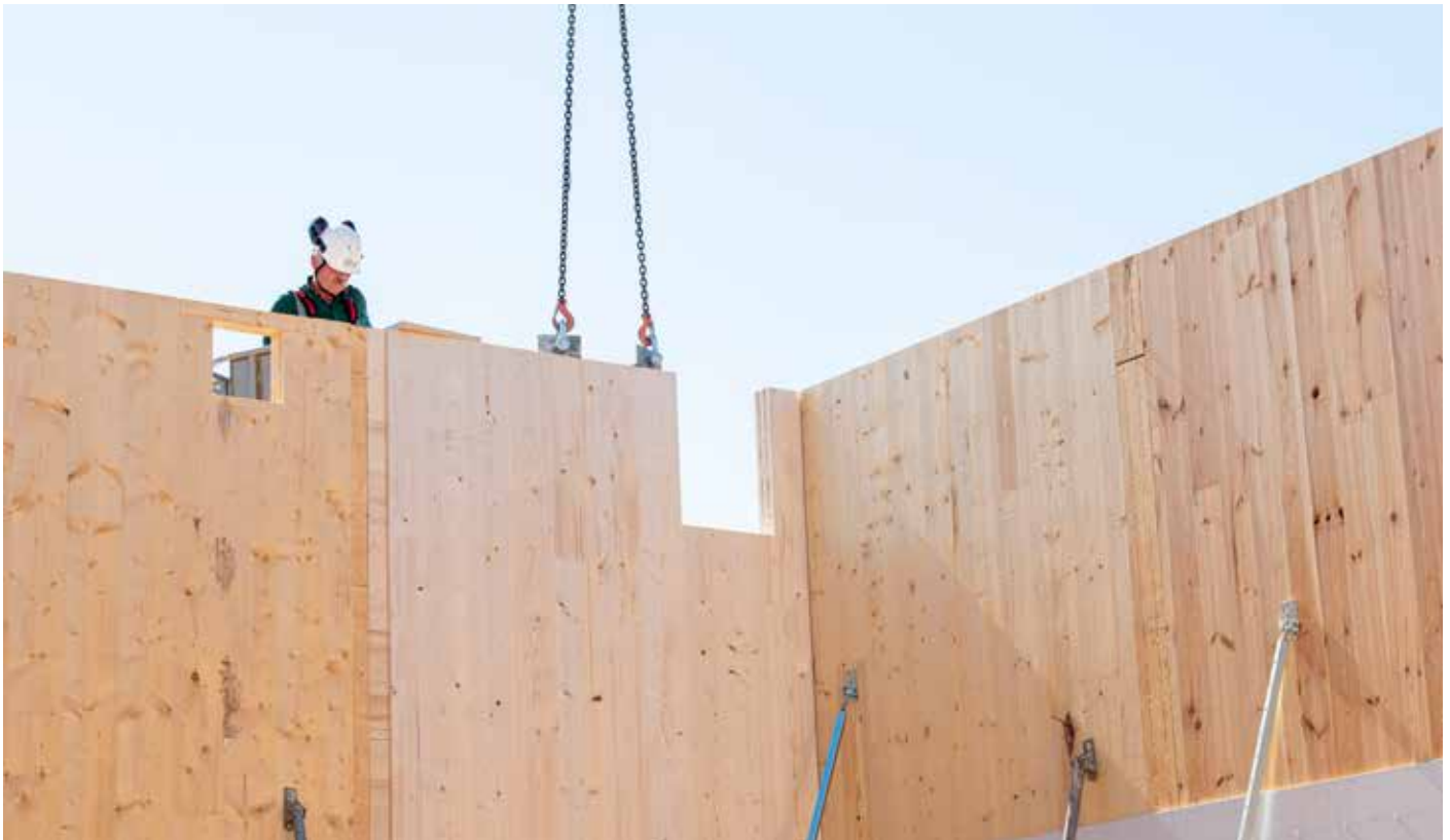
Fertige Holzbauteile, hier in Form von Brettsperrholz (CLT)